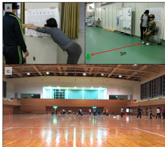
Fig. 3. Picture of Functional Reach (a), Up & Go (b) and 12 minute walk test (c).

長方形のコース(1周80m)を設定し、対象者には検者からの合図をもとに歩行を開始させた。スタート地点には時間を計測する検者が立ち、対象者が一周するごとに用意しておいた割り箸を渡して周回数の管理を行った (Fig. 3-c)。対象者には、もし疲れたり休養が必要であれば、立ち止まったり、椅子などで休んでもよい旨をあらかじめ指導した。歩行は12分間行わせ、検者の合図にて停止させた。終了の合図の直後に、立ち止まっている対象者にBorgの主観的運動強度評価表を見せて運動中の運動強度を調査するとともに、5m間隔でコース上に置かれたコーンから最も対象者に近いコーンを採用して歩行距離を求めた。測定は事前に十分な説明を行った上で、1回のみ測定とした。