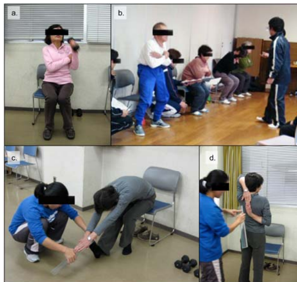
Fig. 2. Picture of Arm Curl

どちらか好きな方の手の指先を伸ばしたまま、真上に上げ、その状態のまま、肘を曲げ手のひらを背中につけさせた (肩関節外旋, 前腕回外位)。次に、もう一方の手を、指先を伸ばした状態で下側から背中に回し、手の甲を背中につけた状態とした (肩関節内旋, 前腕回内位)。そして、両方の手をできるだけ近づけ、手をさわる又は、重ね合わせる様に指示した。測定は、下側から背中に回した中指の先を基準に (中指先端を 0cm とする)、上の中指との距離をメジャーにて 0.1cm 単位で求めた (Fig. 2-d)。0cm を超えた部分 (中指が重なり合わさる以上になった場合) をプラス標記とし、超えない場合はマイナス標記とした。測定は 2 回行い、数値が大きい方を採用した。