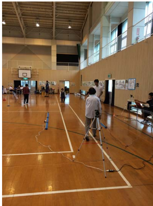
Fig. 4. A picture of gait testing

8m のコース(歩行能測定は 7.9m 区間)での普通歩行と自発的的最大速度歩行で行った。普通歩行は普段何も考えずに歩く速度で歩行するように指示し、自発的的最大速度歩行は決して走らないことを説明した上で、出来るだけ速く歩行するように指示した。マーチテストは、開眼によるその場足踏みを実施させた。足踏みは 20 秒間実施させ、テンポや足を上げる高さなどは対象者の自由とした。歩行テスト(普通歩行および自発的的最大速度歩行)並びにマーチテストは、十分な説明と練習試行の後、それぞれ 1 回ずつの測定を行った。歩行テストにおけるオプトゲイトでの評価項目は、左右のステップ長およびストライド長の平均値、歩行速度、立脚期・遊脚期の時間、両脚支持時間とした。マーチテストの評価項目は、左右それぞれの立脚期・遊脚期の時間、1 秒間のステップ数、サイクルとした。