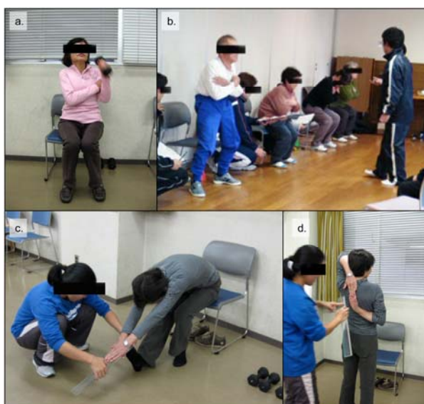
Fig. 2. Picture of Arm Curl

どちらか好きな方の手の指先を伸ばしたまま、真上に上げ、その状態のまま、肘を曲げ手のひらを背中につけさせた (肩関節外旋, 前腕回外位)。次に、もう一方の手を、指先を伸ばした状態で下側から背中に回し、手の甲を背中につけた状態とした (肩関節内旋, 前腕回内位)。そして、両方の手をできるだけ近づけ、手をさわる又は、重ね合わせる様に指示した。測定は、下側から背中に回した中指の先を基準に (中指先端を 0cm とする)、上の中指との距離をメジャーにて 0.1cm 単位で求めた (Fig. 2-d)。0cm を超えた部分 (中指が重なり合わさる以上になった場合) をプラス標記とし、超えない場合はマイナス標記とした。測定は 2 回行い、数値が大きい方を採用した。